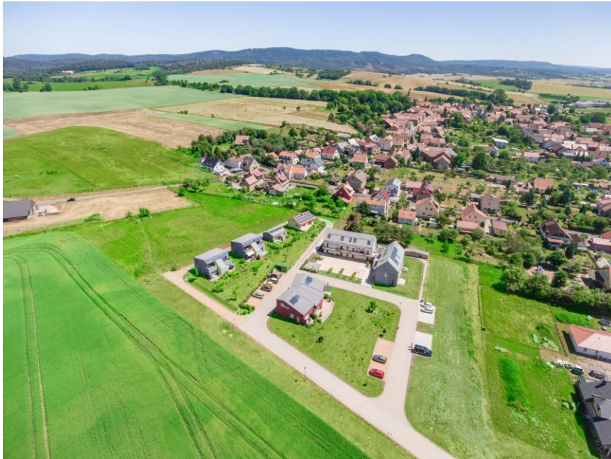
Möhra gesamt mit Blick auf Dharmazentrum Möhra und Wohnprojekt Möhra Augsut 2019